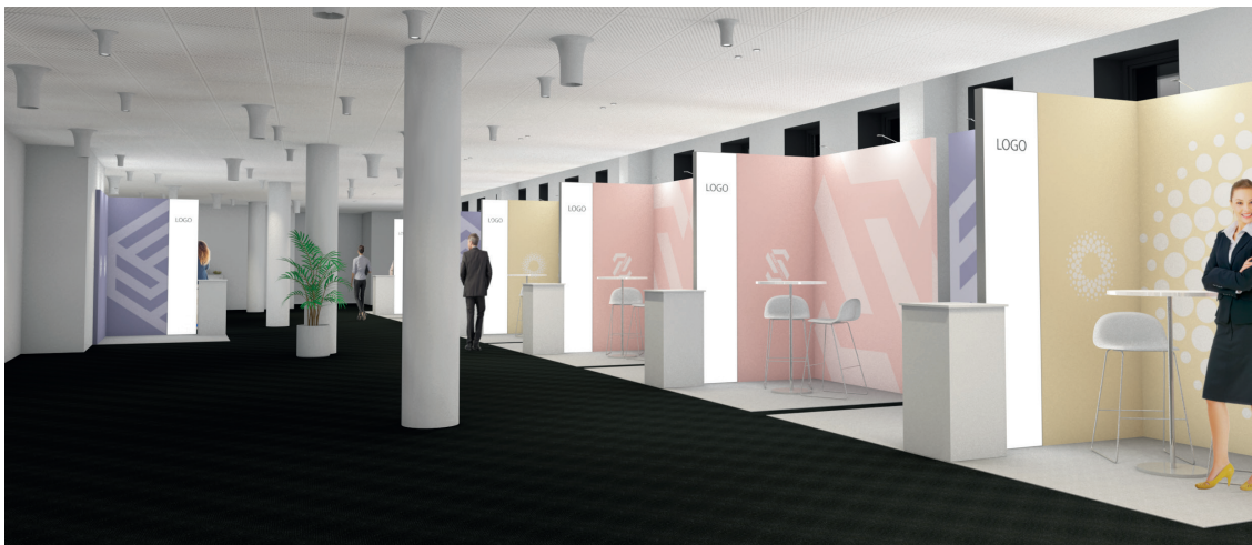
Eksempel: Stands på Digitaliseringskonferansen.

Ønsker dere hjelp med oppsett av grafiske filer, ta kontakt! Vi kan hjelpe deg for kr 1 290 per time (medgått tid).